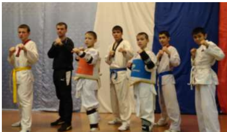
(Показательные выступления команды КШИ по тхеквандо.)

Состав команды: 10 человек, на каждый вид соревнований по 2 человека (юноши и девушки).