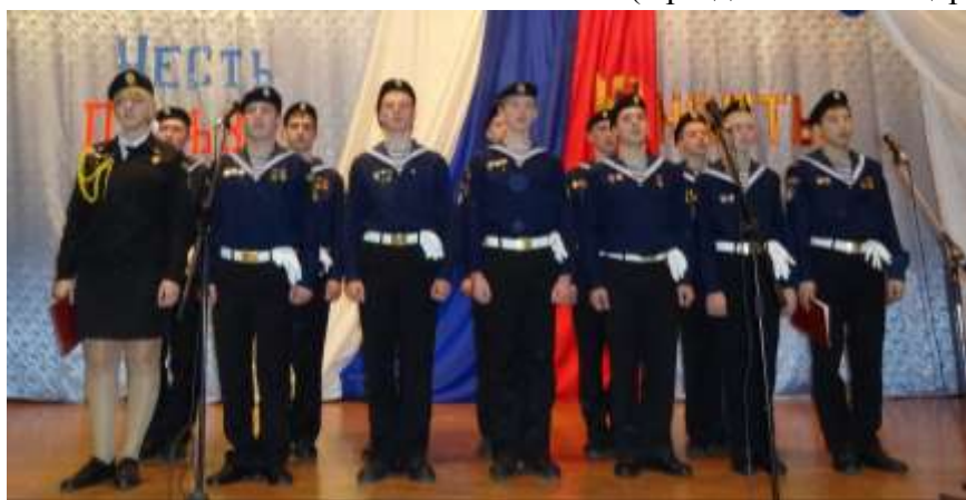
(Выступление кадетской школы имени капитана Первого ранга Банных г.Сысерть)