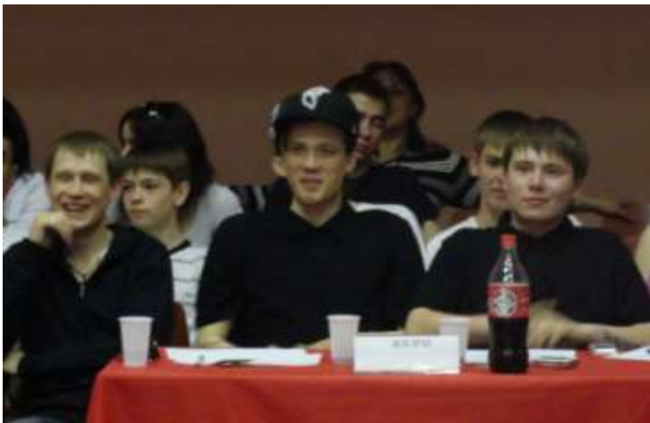
(жюри конкурса Рэп исполнителей)