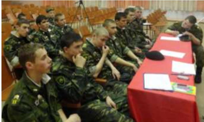
(на фото: команда кадетской школы на этапе «России – верные сыны!», интеллектуальный конкурс)