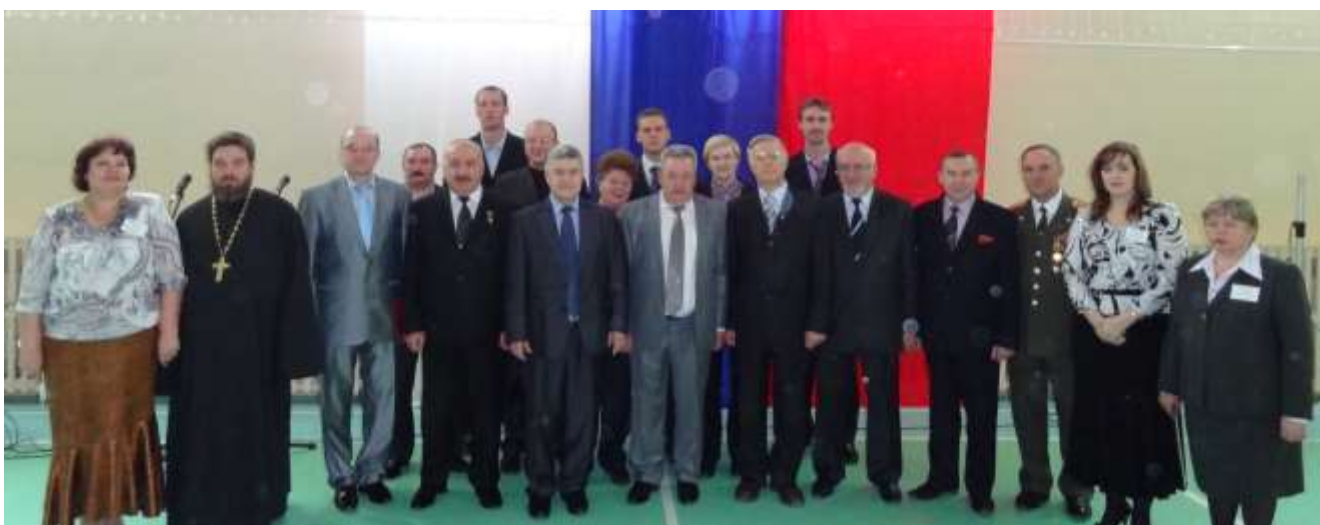
(На фото: гости на открытии Центра ПВиДП)

Содержательная деятельность в Центре включала в себя комплекс образовательно-воспитательных и физкультурно-оздоровительных мероприятий, направленных на развитие у молодежи любви к Отечеству и готовности к активному участию в деле его укрепления и защиты.