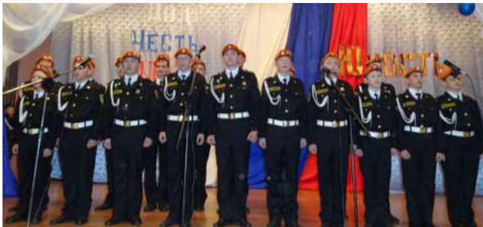
(Выступления кадетской школы училища «Рифей» г.Екатеринбург)