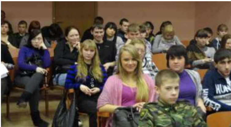
(Учащиеся ВПМТТ «Юность» с интересом слушают приглашенных гостей)