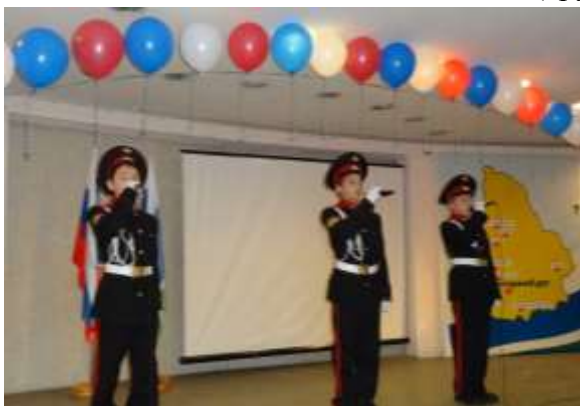
(Выступление учащихся КШИ)