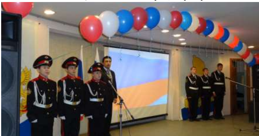
(под Гимн России – смирно!)