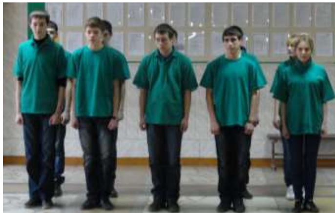
(на фото: команда ВП МТТ «Юность» на этапе «Статен в строю!», конкурс строя и песни)