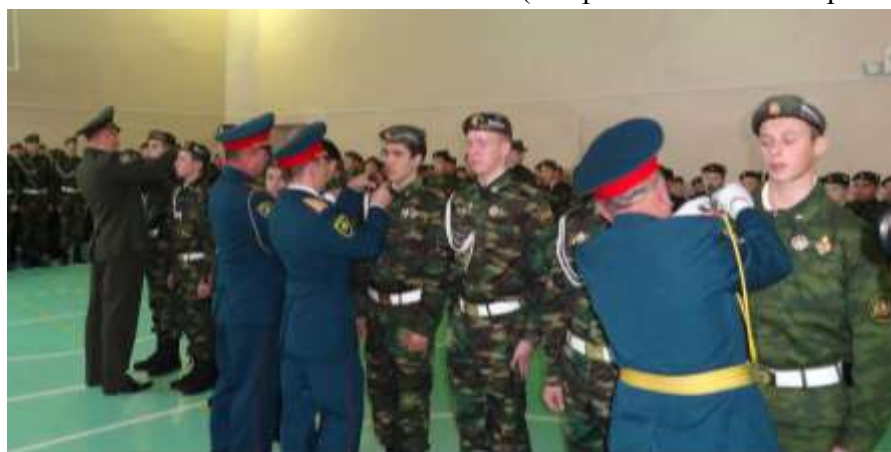
Вручение погон «Вице - сержант»