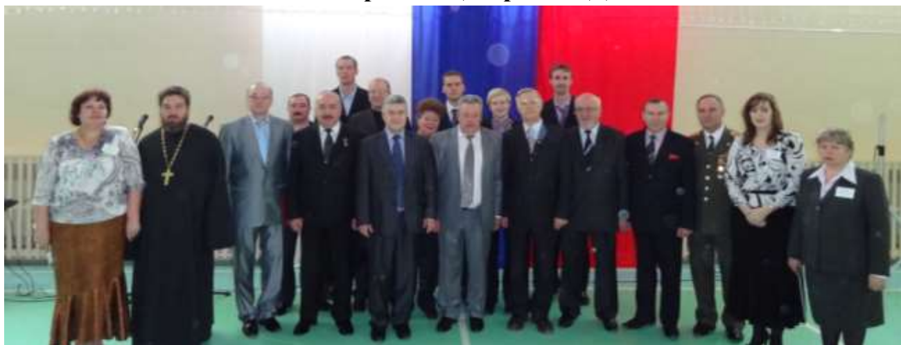
(На фото: гости на открытии Центра ПВиДП)