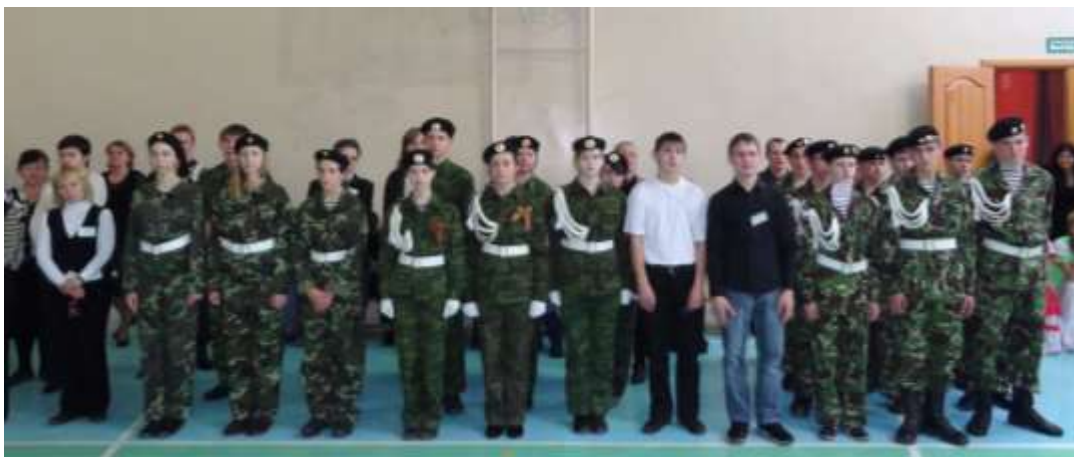
(Гости праздника: учащиеся ГО Верхняя Пышма, занимающиеся в патриотических клубах)