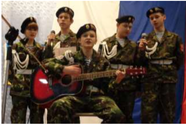
(на фото: команд патриотического клуба «Витязь» пос. Кедровое, визитная карточка команды)