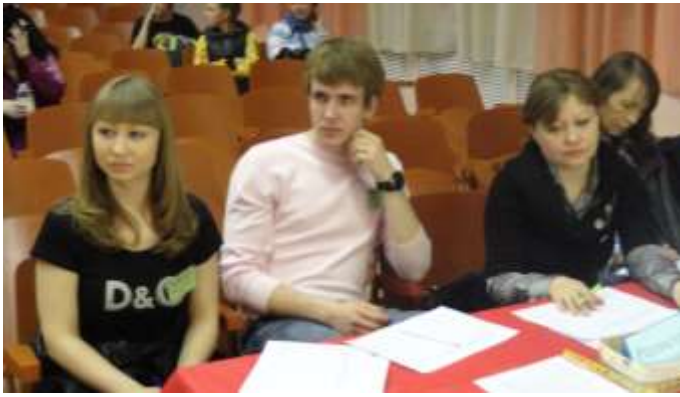
(жюри танцевального конкурса в стиле хип-хоп, электродэнс)