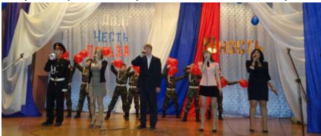
(Праздничный концерт в актовом зале)